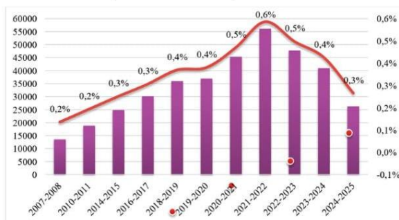
Graphique n° 1 : Enfants instruits dans la famille : effectifs (axe de droite) et en % de la population âgée de 6 à 16 ans (axe de gauche)

Champ : Enfants âgés de 6 à 16 ans instruits dans la famille.